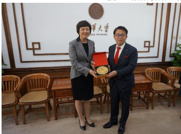
清華大学訪問時の様子（2019年5月）