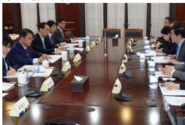
上海交通大学訪問時の様子（2019年5月）