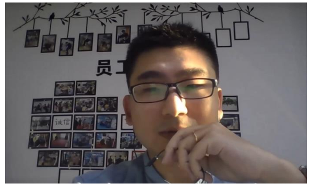
マッチングプログラム ピッチイベントの様子（2022年9月） （オンライン開催）