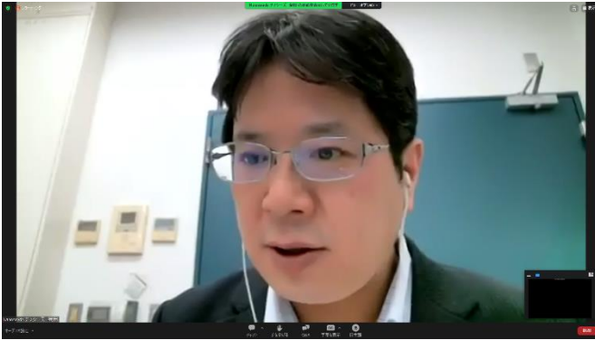
県内スタートアップ支援プログラム ピッチイベントの様子（2023年1月） （オンライン開催）