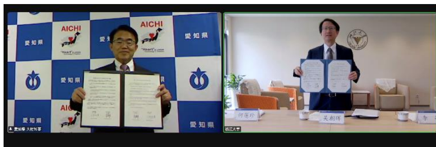
浙江大学とのMOU締結式の様子（2022年6月）