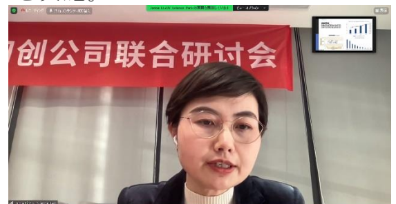
セミナーの様子（2023年3月） （オンライン開催）