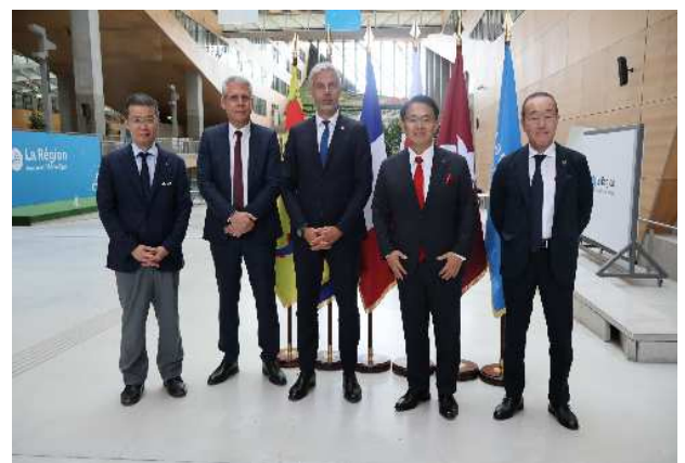
ボキエ議長(左から3番目)、ムニエ副議長(左から2番目)との記念撮影