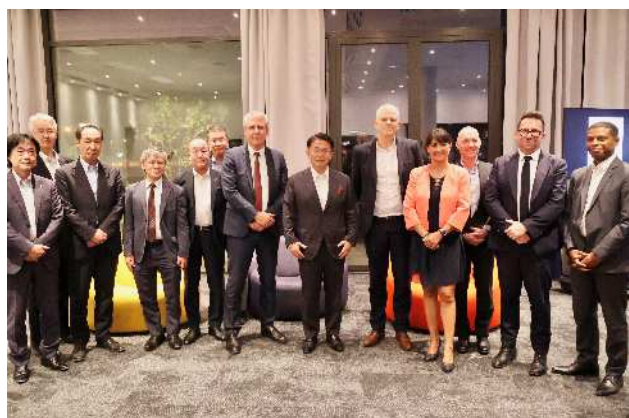
GL イベントスベニューズ シゼロン CEO （右から 5 番目）、GL イベントス幹部等と の記念撮影