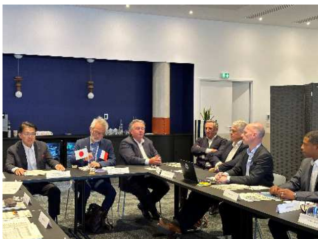
GL イベントス幹部との面談の様子

主催：GL イベントス 共催：株式会社新東通信 協力：愛知県 規模（想定）：出展 250 社、来場者 15,000 人