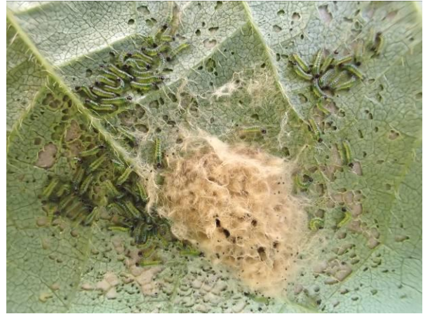
図3 ハスモンヨトウの若齢幼虫