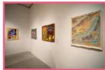
2022年9月「あいちアール・ブリュット展 美術館」