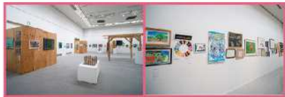
2022年9月「あいちアール・ブリュット展 公募作品展」

過去のあいちアール・ブリュット展で、2回入選された方、アート雇用で活躍されている方の作品を中心に特別展示をご紹介します。