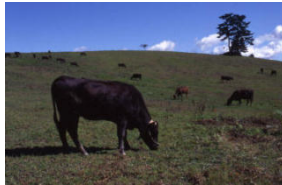
のんびり草を食べている牛