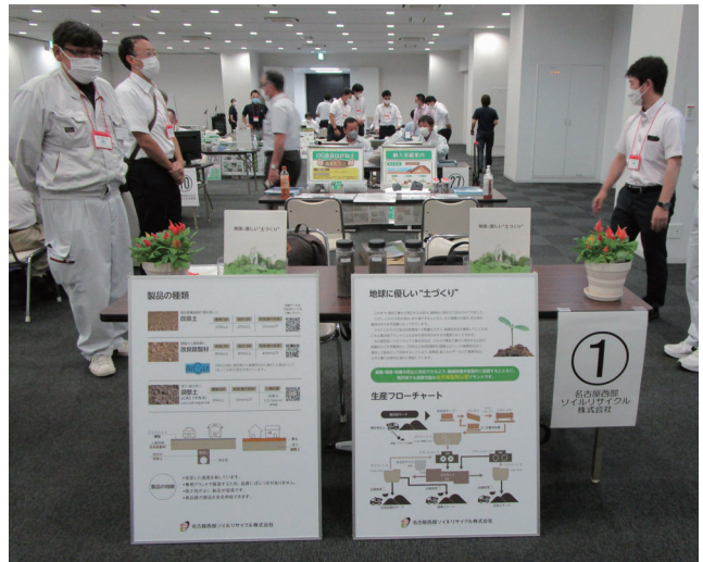
あいくる材見本市