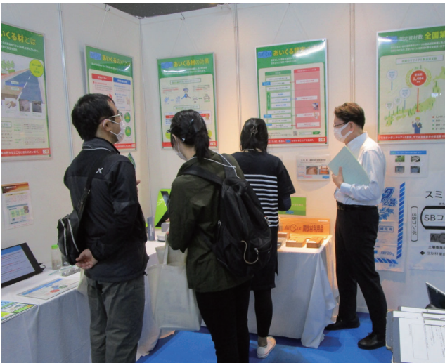
SDGs AICHI EXPO2022