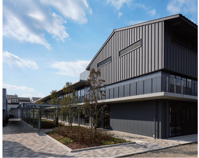
境界ブロック、インターロッキング、側溝 [愛知県立岡崎高等技術専門学校]