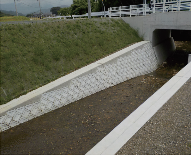
積みブロック [宇利橋]