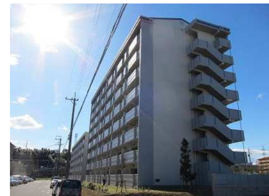
公営住宅等整備事業 整備イメージ