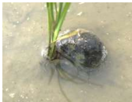
写真2 食害中のスクミリンゴガイ