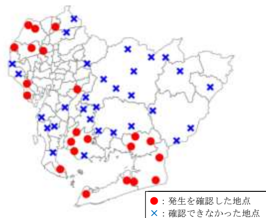
図2 令和2年のスクミリンゴガイ発生地点 （6月下旬及び7月下旬 県内155筆の水田調査）