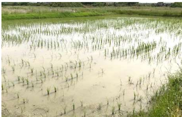
写真1 スクミリンゴガイ被害ほ場