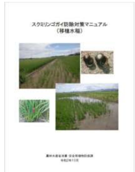
写真3 スクミリンゴガイ防除対策 マニュアル（表紙）

上記対策技術の詳細は、「防除対策マニュアル（スクミリンゴガイ防除対策マニュアル（移植水稻）」（令和2年11月、農林水産省）を参照。