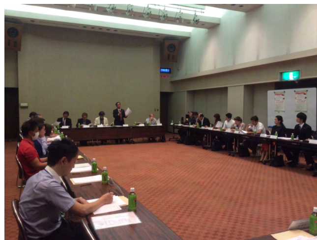
瀬戸旭在宅医療介護連携推進協議会実行委員会