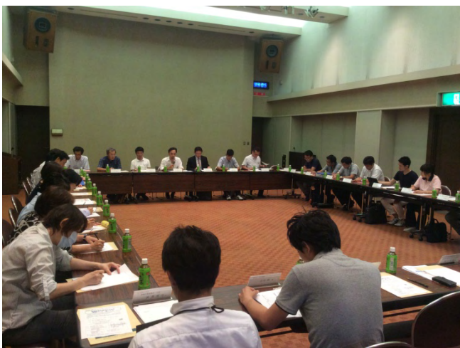
瀬戸旭在宅医療介護連携推進協議会