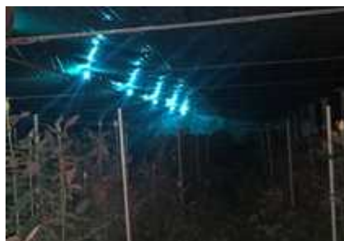
写真2 夜間の点灯の様子

図2にうどんこ病の発病率の推移を示した。試験区は、12月4日を除いて対照区よりも発病率が低くなった。10月3日と12月4日は両区とも発病率が高くなったが、花茎におけるうどんこ病の発生位置は、試験区が下位葉のみであったが対照区は上位葉まで発生していた。試験農家は、試験区での発生状況について、「下葉を除去すれば出荷に問題はない」と評価していた。