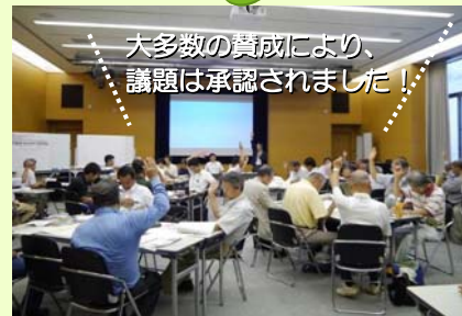
大多数の賛成により、議題は承認されました!