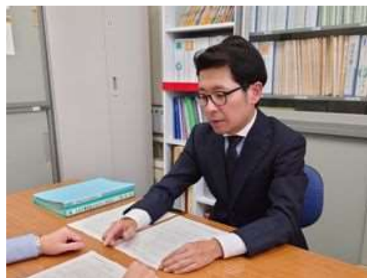
「同僚職員に事務書類の説明を行う朝日主査」

事務主査の仕事に意欲的に取り組み、2022年度からは校内のコミュニティ・スクール地域連携担当職員としても活躍している。