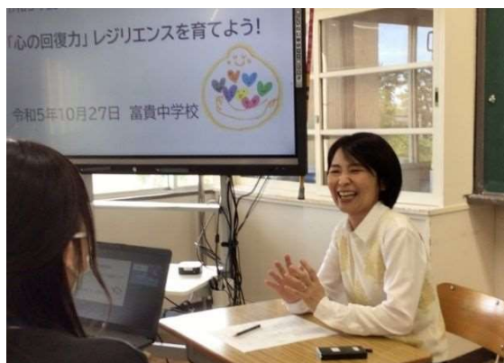
「校内研修で講師を務める新美主任養護教諭」

朗らかかつ誠実な人柄であり、心身に様々な問題を抱えた生徒に心を込めて寄り添う姿は教職員の模範となっている。同僚職員への的確に助言することに加え、経験年数の少ない他校の養護教諭からの保健室経営等に関する相談にも積極的に対応し、その指導に力を発揮している。