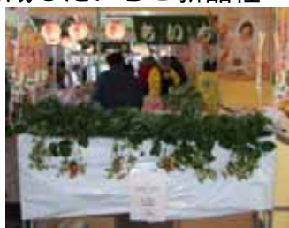
いちご新品種「ゆめのか」