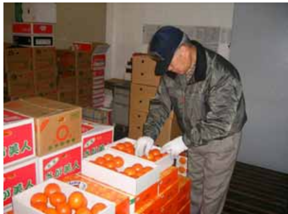
果物専門店向けにカンキツを再選別する仲買人

産地としては、産地のことを真剣に考え、販売面で産地を支援するこうした仲買人によって支えられていると思われれます。産地サイドとしても、こうした仲卸業者の期待を裏切らないよう、品質管理、安全・安心に留意して出荷することが大切です。