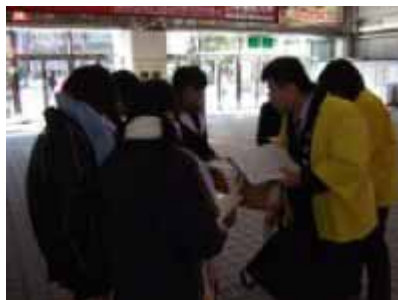
アンケートの実施