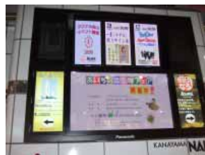
電光掲示板を使った周知