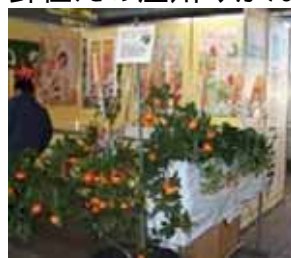
鉢植え温州みかん