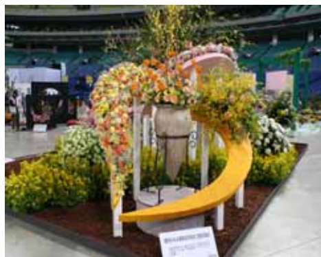
前回のディスプレイコンテスト作品