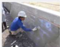
摩耗した水路壁への 表面被覆材の塗布