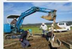
コンクリート水路の更新