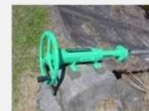
ゲート、バルブの更新