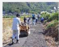
未舗装農道の舗装