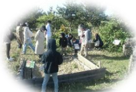
自然観察会の様子

*たはら里山の会は、田原市が開く里山保全講座を修了した市民からなる団体で、市内で里山を守る取組を実施しています。