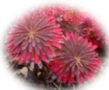
紅葉したハギクソウ