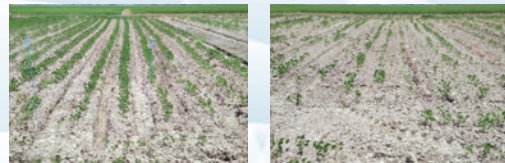
生育期の大豆/左:高速播種機 右:慣行