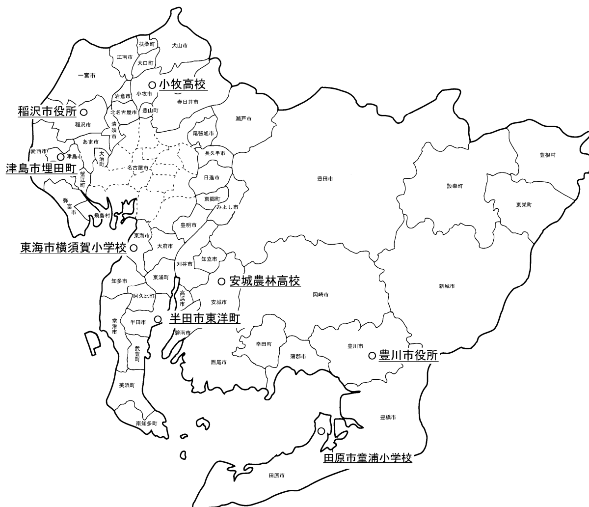
図 4-8 アスベスト大気環境調査地点位置図