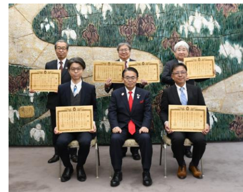
2023年度「愛知県ファミリー・フレンドリー企業」表彰式