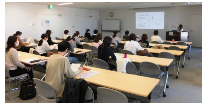
職場復帰・再就職準備セミナー