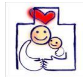
愛知県ファミリー・フレンドリー・マーク