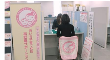
カウンセリングの様子

(2) 場所：名古屋市中村区名駅4丁目4-38 愛知県産業労働センター17階（あいち労働総合支援フロア内）