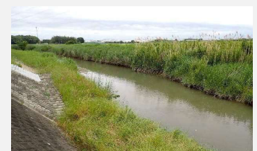
ヌートリアが生息する河川