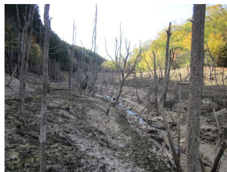
↑上流側からの景色