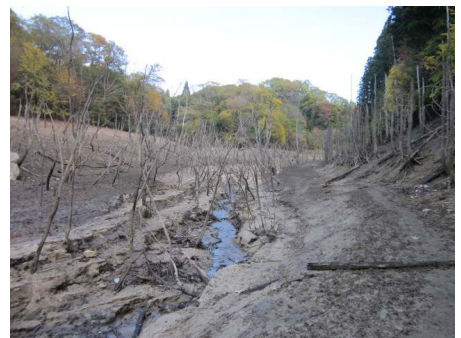
↑ダム（下流）側からの景色