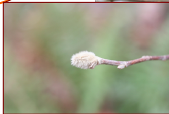
写真：シテコブシの冬芽