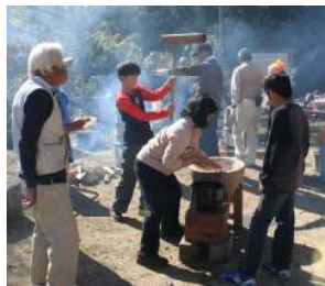
収穫祭のようす みんなのこえ