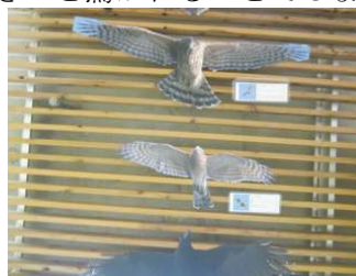
展示のようす（一部分）

ワシタカ（猛禽類）の仲間が、空を悠然と飛んでいる姿を見たことはありますか。とても高いところを飛んでいるため、地上から観察すると、かなり小さく見えてしまいますが、トビは翼を広げるとなんと 1m70cm 近くもあります！「ワシタカの飛翔」展示では、写真を実物大に拡大して展示を行っております。種類は、オオタカ（成）（若）、ハイタカ、ノスリ、トビ、ハチクマ、ミサゴです。ちなみにこれらの猛禽類は何れも海上の森で観察することができる種類です。比較しやすいように、身近なハシブトガラスも一緒に展示してあります。猛禽類の大きさにきっと驚かれることでしょう。