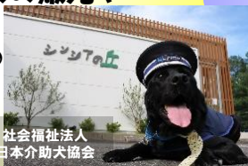
社会福祉法人 日本介助犬協会