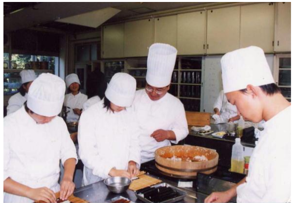
<調理師による実技指導>

食品や調理に関する専門的な知識と技術を身に付け、国際社会に対応できる調理師に必要な能力と態度を育てます。