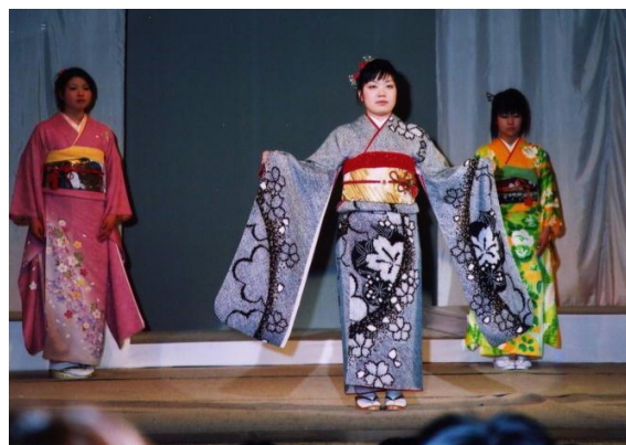
<ファッションショー>

「生活産業基礎」 「課題研究」「生活産業情報」 「保育基礎」「保育実践」 「服飾文化」 「ファッション造形基礎」 「ファッション造形」 「ファッションデザイン」 「服飾手芸」等