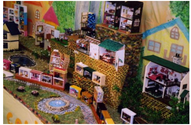
<ドールハウスの展示>

生活及び生活空間を、快適に美しくデザインする知識と技術を学び、豊かな創造性と感性を養い、生活関連産業で活躍できる能力と態度を育てます。