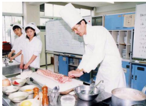
<調理師による実技指導>

栄養や食品、献立と調理及び集団給食など、食品に関する専門的な知識と技術を深く学習し、豊かな食文化を伝承し、未来に発展させる能力と態度を育てます。