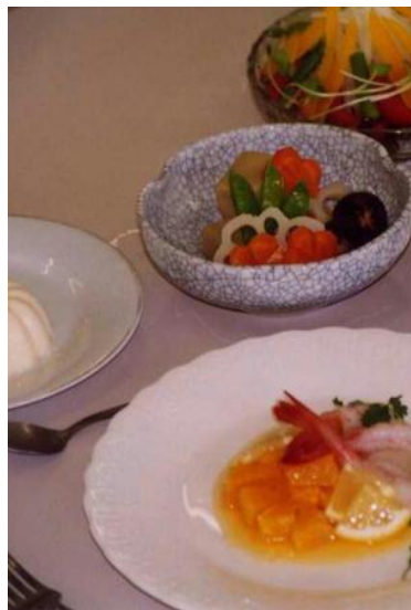
<技術検定食物調理1級>