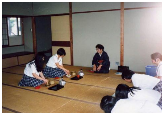
<日本文化（茶道）実習>

家庭に関する基礎的な知識と技術を身に付け、外国や我が国の生活文化に関する理解を深め、幅広く社会で活躍できる能力や態度を育てます。