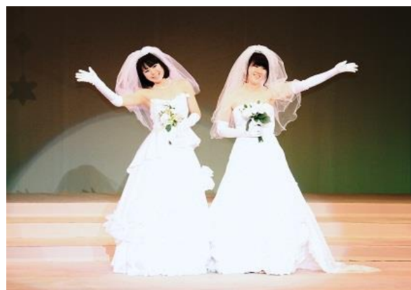
<ファッションショー>

服飾に関する基礎的、専門的知識と技術を身に付けるとともに、豊かなファッション感覚を養い、新しい時代に即応できる創造力と実践力を育てます。ファッション創造科は、保育に関する知識・技術を身に付けることもできます。