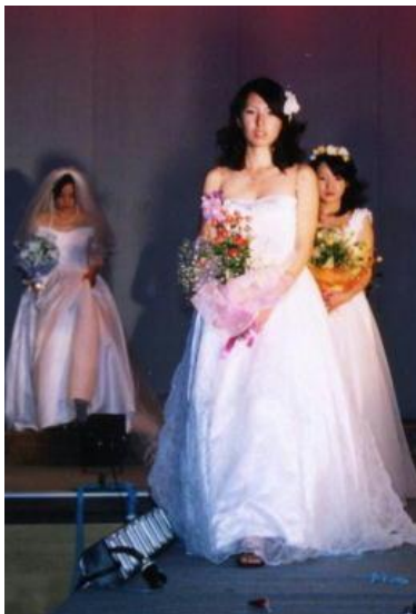
<ファッションショー>