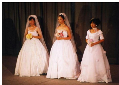
<ファッションショー>

「生活産業基礎」 「課題研究」「生活産業情報」 「保育基礎」「保育実践」 「生活と福祉」 「ファッション造形基礎」 「フードデザイン」 等