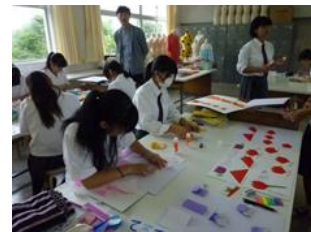
保育技術検定<造形表現技術>