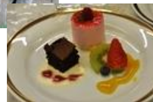
<テーブルマナー実習>