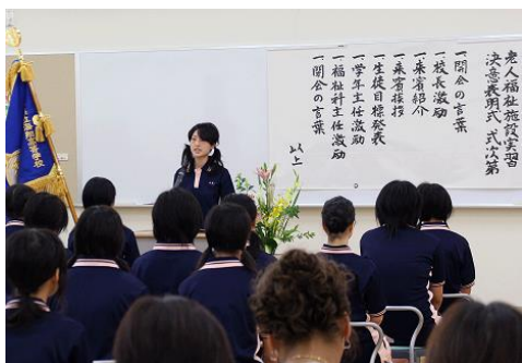
<施設実習決意表明式>