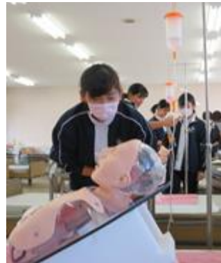
<医療的ケアの実習>

「社会福祉基礎」 「介護福祉基礎」 「コミュニケーション技術」 「生活支援技術」 「介護過程」 「介護総合実習」 「介護実習」 「こころとからだの理解」