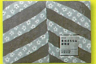
織り込み技法による記念銘板 作/陶芸家 水野教雄