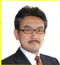
早稲田大学理工学術院教授