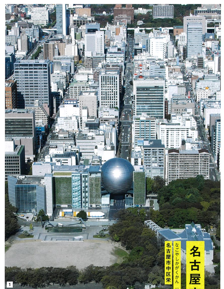
なごやしがくかん りこうかん・てんもんかん 名古屋市中区栄