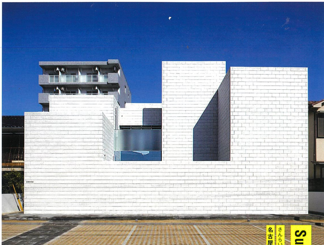
さんらいとおぶかーむ 名古屋市名東区代万町

受賞作品の詳しい評価はそれぞれの選評に譲るが、建築を通して都市の文化的景観や地域の自然風景のあり方を提示する、まちなみのインフラストラクチャーともいえる意欲作が多かった様に思う。今回、大賞については選考委員全員の合意に至らず受賞作はなかった。新しい建築文化の創造と地域のまちなみを先導する意欲的な挑戦をさらに期待したい。