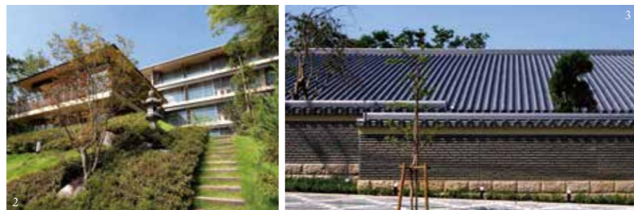
1,2 photo/株式会社 エスエス 名古屋支店(2010) 3 photo/株式会社 竹中工務店(2010)