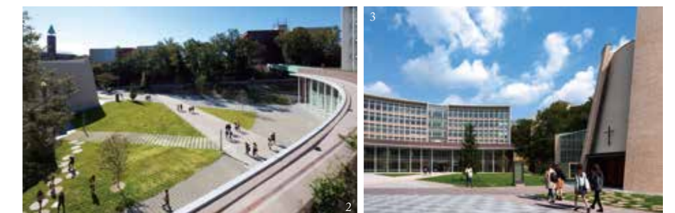
1,2,3 photo/佐々木俊徳[カドール](2014)