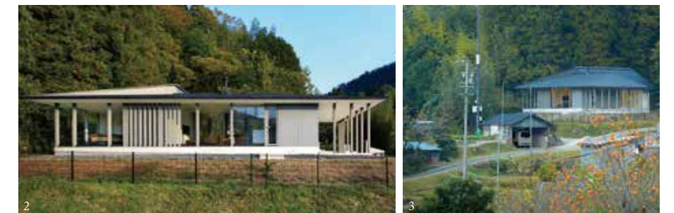
1,2,3 [フォワードストローク] (2013)