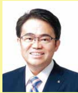
愛知県知事 大村秀章 Hideaki Omura

近年、産業や社会構造の変化に伴い、魅力的で個性的な美しいまちなみや景観の形成が求められるようになり、景観まちづくりに関する取り組みが全国で展開されております。