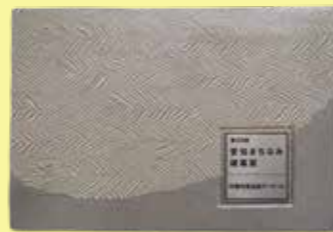
練り込み技法による記念銘板 作/陶芸家 水野教雄