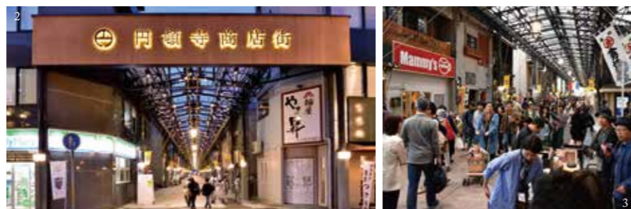
1,2,3 photo/齋藤正吉[齋藤正吉建築研究所](2015)