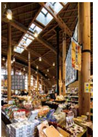
1,2,3 (2015)