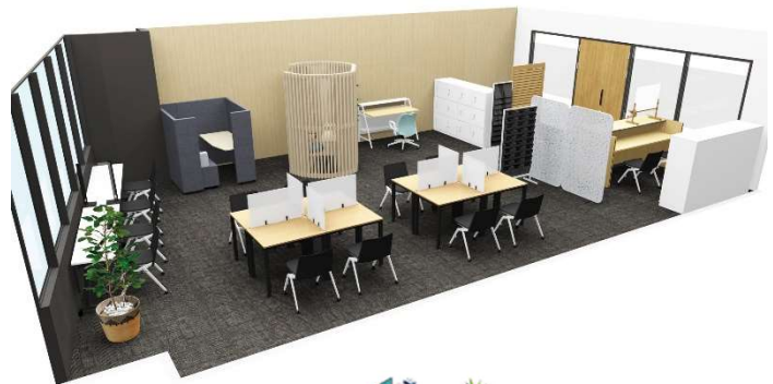
あいちテレワーク・モデルオフィス

詳しくは Web ページをご覧ください。(https://www.aichi-telework.pref.aichi.jp/)