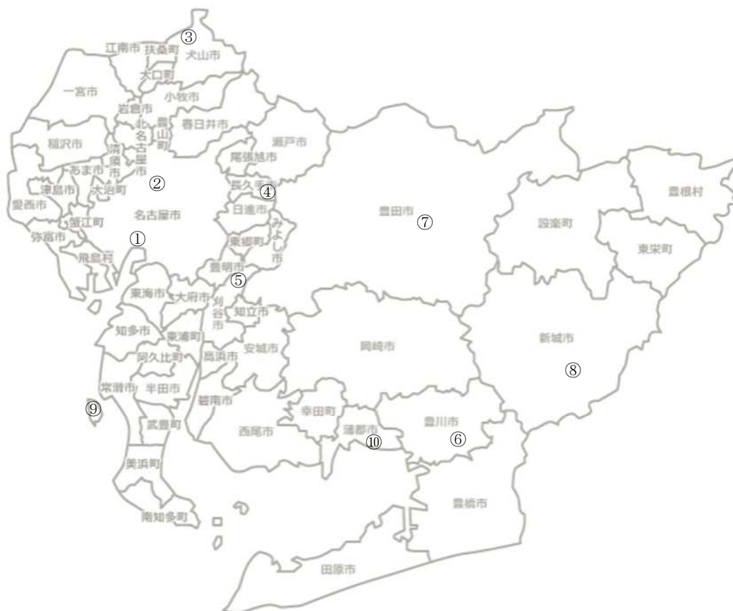
図-2 調査地分布図（数字は調査地ID-表-1参照-）