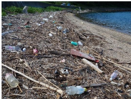
海岸に漂着したプラスチックごみ