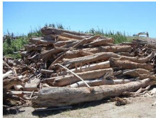
大雨後に港で回収された流木

流域圏での海洋ごみ対策の推進により、伊勢湾の良好な景観や海洋環境の保全を図ることを目的に、岐阜県・愛知県・三重県が共同で本計画を策定