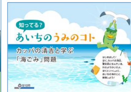
愛知県 環境学習プログラム