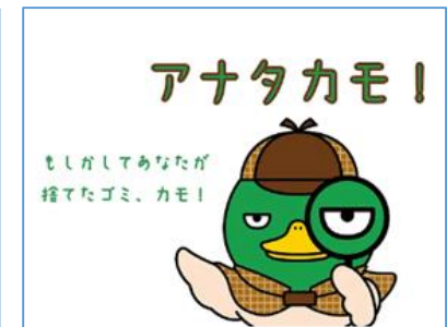
三重県 普及啓発動画