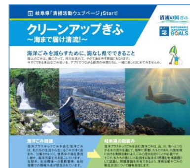
岐阜県 清掃活動ウェブページ