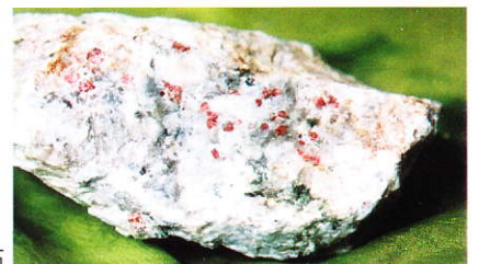
ペグマタイト中のザクロ石

自然をとうとび、自然を愛し、自然に親しもう。 自然に学び、自然の調和をそこなわないようにしましょう。 美しい自然、大切な自然を永く子孫に伝えよう。 自然保護憲章より