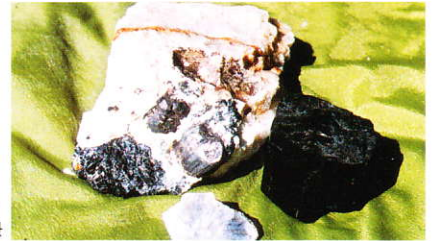
ペグマタイト中に産する ザクロ石・電気石・白雲母