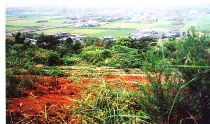
保全地域付近の畑

一般的に領家変成帯の岩は、ごはんにごま塩をふりかけたように見える花崗岩（みかげ石）の仲間が多いのですが、青鳥山には青黒く、ずっしり重い感じがしてハンマーでたたいてもなかなか割れにくいハンレイ岩という岩が顔を出しています。花崗岩と同じようにマグマがゆっくり冷え固まってで