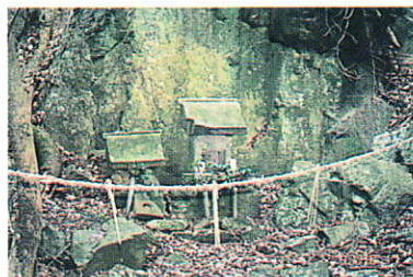
祠付近の角閃石片岩の露頭