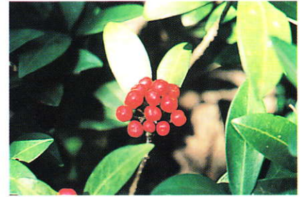
ミヤマシキミ (ミカン科)