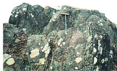
山頂部の角閃石片岩の露頭