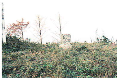
山頂にある三等三角点

角閃石片岩は、灰色を帯びた濃緑色をしており、結晶は細粒で日の光に当てると新鮮なものでは角閃石の結晶がキラキラ輝いて見えます。詳しい研究によると、ここの角閃石片岩の造岩鉱物の主成分は角閃石で、副成分として輝石 キョウシキ