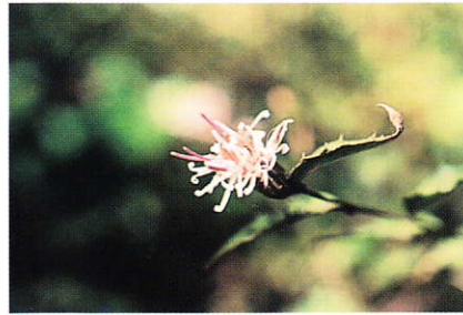
コウヤボウキ (キク科)

東斜面は平成8年4月に生じた山火事により焼け、焼け残った立ち枯れ木の間からはクリやゴンズイの萌芽、ヤマハギ、クサギ、アカメガシワの発芽など、植生が自然回復してきています。