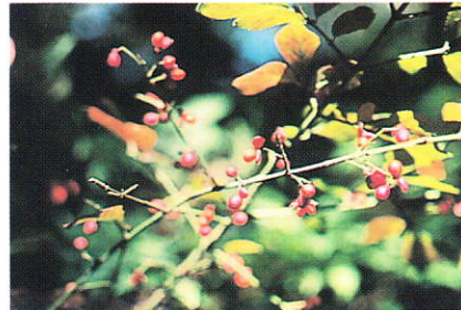
コマユミ (ニシキギ科)