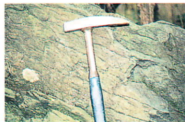
角閃石片岩の片理構造