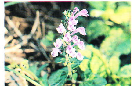
タツナミソウ (シソ科)