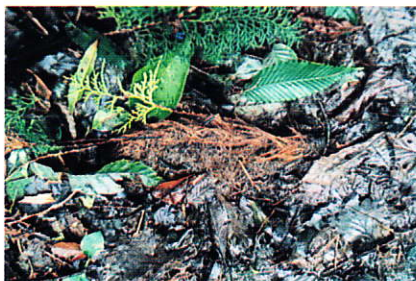
ぬた場に残されたイノシシの毛