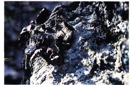
イワタケ (地衣類イワタケ科) 岸壁等に着生します。広く北海道～九州に分布しますが古来不老長寿薬として珍重され今でも食用とされるので普通では見られなくなっています。