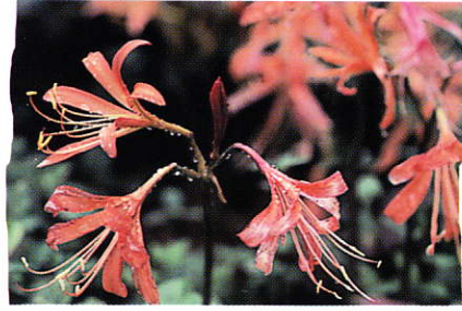
オオキツネノカミソリ (ヒガンバナ科) 白鳥山では8月中旬に花を咲かせます。キツネノカミソリに比べて雄ずいが花びらより長いのが特徴です。