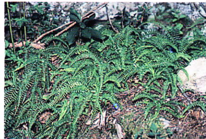
フジシダ (コバノイシカガマ科) 岸壁下の岩屑斜面等に群生します。フジの名前は愛知県犬山市の尾張富士山にちなむものです。