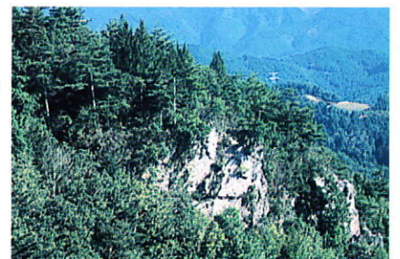
岸壁上のコウヤマキ群落 コウヤマキは白亜紀に出現して北半球に分布をひろげたものですが、現在では地球上で日本の西半部にのみ生き残った日本特産種と考えられています。