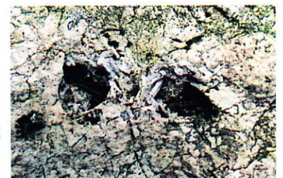
晶洞中にできた水晶