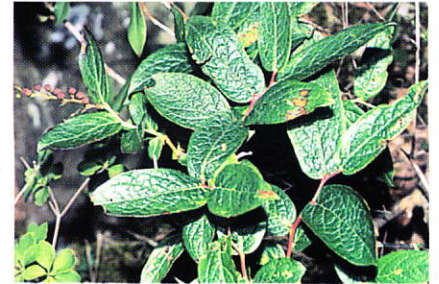
ハナヒリノキ (ツツジ科) 和歌山県以北の本州～北海道に分布する温帯性低木です。葉の粉末が鼻に入るとくしゃみ(はなひり)が出るから名付けられたといわれます。