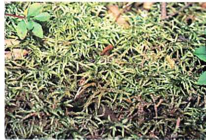
タチハイゴケ (蘚類ヤナギゴケ科) 亜高山、高山帯にひろく分布する大型の蘚類です。愛知県では、白鳥山、茶臼山、面の木峠西方、段戸山にのみ生育が知られています。