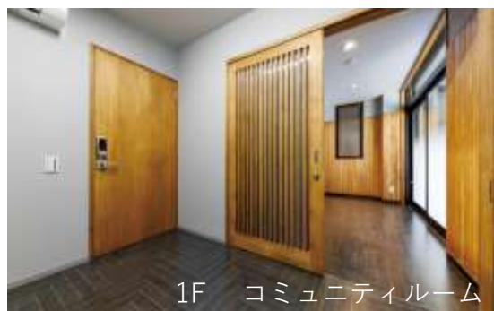
1F コミュニティルーム

竣工／2023年2月 施主／愛知県警察本部 設計・監理／株式会社安藤建築設計 施工／ユニテック株式会社