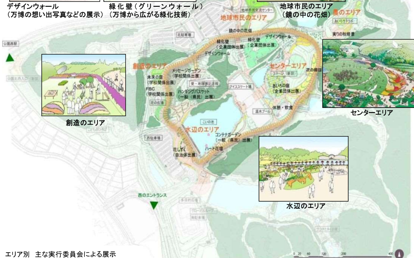
エリア別 主な実行委員会による展示