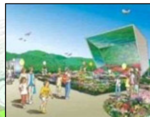
地球市民のエリア (鏡の中の花畑)