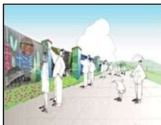
デザインウォール (万博の思い出写真などの展示)