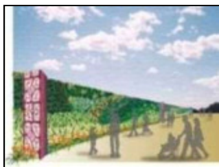
緑化壁(グリーンウォール) (万博から広がる緑化技術)