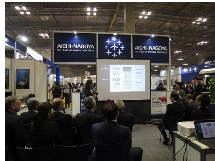
※イメージ図。上記写真はJA2018の会場風景です。

国内最大級の国際的な航空宇宙分野の展示会である「2024国際航空宇宙展(JA2024)」が本年10月に東京で開催されます。