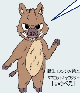
野生イノシシ対策室 マスコットキャラクター 「いのべえ」

QRコードを読み取ると、愛知県のWebページで血液検体採取停止期間が見られるべえ！