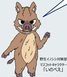
野生イノシシ対策室 マスコットキャラクター 「いのべえ」

QRコードを読み取ると、愛知県のWebページで血液検体採取停止期間が見られるべえ！