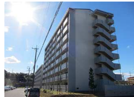
公営住宅等整備事業 整備イメージ

公営住宅等整備事業 愛知県、豊橋市、岡崎市、半田市、豊川市、碧南市、刈谷市、常滑市、豊根村