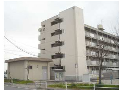
公営住宅等ストック総合改善事業 整備イメージ(EV設置)

公営住宅等ストック総合改善事業 愛知県、豊橋市、岡崎市、一宮市、瀬戸市、半田市、春日井市、豊川市、津島市、碧南市、刈谷市、安城市、西尾市、蒲郡市、小牧市、稲沢市、新城市、東海市、大府市、知多市、知立市、尾張旭市、高浜市、田原市、みよし市、豊山町、大口町、武豊町、東栄町、豊根村