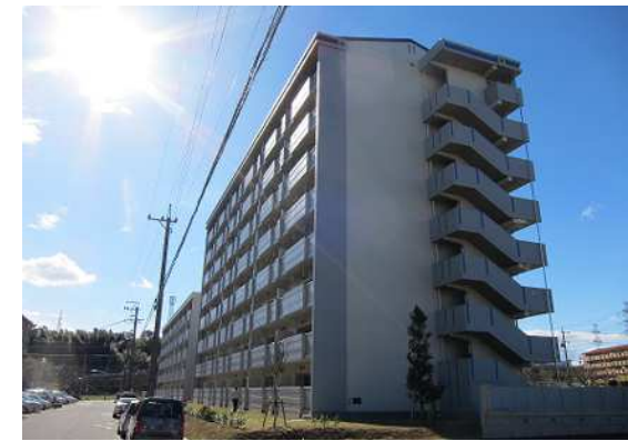
公営住宅等整備事業 整備イメージ