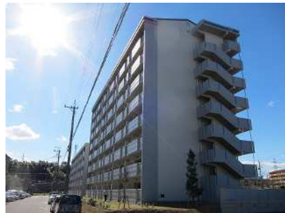
公営住宅等整備事業 整備イメージ