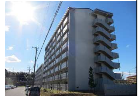
公営住宅等整備事業 整備イメージ