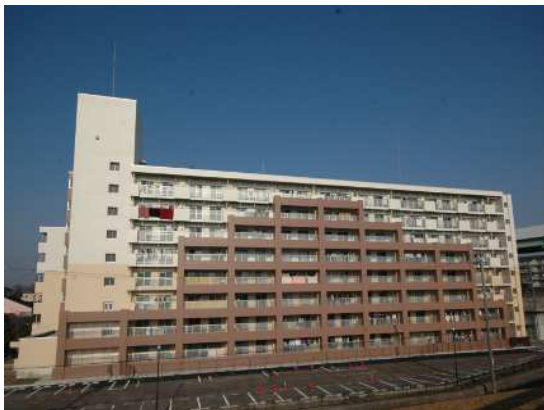
公営住宅等ストック総合改善事業 整備イメージ(耐震改修)