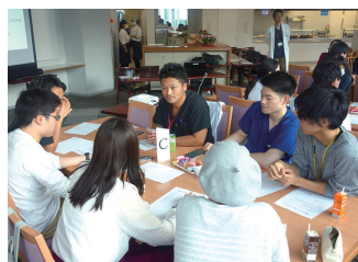
＜レジデントカンファレンス＞