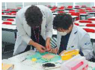
＜縫合トレーニング＞

藤田学園建学の精神「独創一理」に基づいた良い臨床医(病者に共感する心を持ち、ほかの医療者と協調して最良の医療を行い、かつ後継者の育成に積極的な医師)を育てることを目的としています。メディカルスタッフとの協調(アセンブリ精神)のみならず、本学、他学出身者が切磋琢磨しながら2年間の初期研修をともに行うことで、柔軟性に富み自律的な学びができる能力を身に付けることが可能です。初期研修の目標は医師としての人格を涵養し、将来の専門性にかかわらずプライマリ・ケア医としての基本を身に付けるために必須の態度・技能・知識のEssential Minimumを確実に修得することにあります。その観点から本プログラムの最大の特徴は、1~3次まで幅広い重症度の多彩な症例を適切な指導の下で経験できる点です。それにより、種々の診療法、検査、手技を修得し、医療人として必要な患者・医師関係、チーム医療、問題対応能力、安全管理、症例呈示、医療の社会性の意義を理解し、身に付けることができます。さらに初期研修修了後は、専門医研修、大学院進学へ向けたシームレスなロードマップが準備されています。