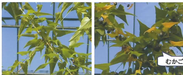
ジベレリン処理区