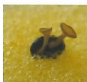
キノコ(子のう盤)の 発生した菌核 (子のう盤上に胞子を 形成し飛散する)