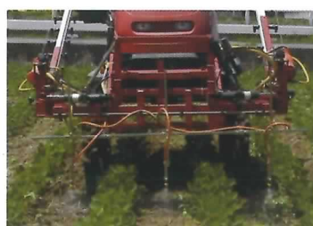
乗用管理機による 畦間・株間散布

その結果、ホオズキ類に対し除草効果が高く有効な除草法であることが分かりました。 （作物研究部）