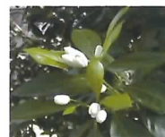
N A A 散布区での 着花状況

夏枝からの夏秋梢の伸長抑制を目的として、1-ナフトレン酢酸ナトリウム水溶剤（N A A）とエチクロゼート乳剤を散布したところ、加温後の着花量は同等ですが、N A A散布ではデンプン蓄積が多く、充実した結果母枝とすることが分かりました。 （園芸研究部）