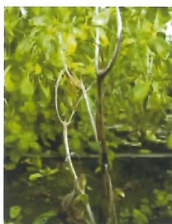
被害の様子 (茎が褐変して枯死)