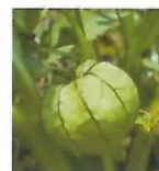
ヒロハフウリンホオズキ