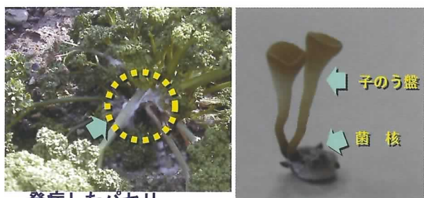
発病したパセリ (白い綿毛状の部分) 子のう盤の発生した菌核

2007年2月に愛知県内でパセリの地際部が腐敗する症状が発生しました。病原性や病原菌の形態等について調査した結果、菌核病であることがわかり、日本植物病理学会において発表しました。この菌は、キャベツやトマトなどの菌核病と同じ菌ですが、パセリでの発病が確認されたのは日本で初めてです。枯死した部分に形成される黒色の菌核(ねずみの糞状)は次作以降の伝染源になるので、被害株・被害残さとともに、ほ場から除去、処分することが大切です。(環境基盤研究部)