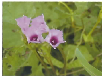
ホシアサガオの花

近年、愛知県のダイズほ場で帰化アサガオ類が発生し、防除が難しいため大問題となっています。従来から4種の帰化アサガオ類の発生が確認されてきましたが、2004~2008年に行った定点調査で「ホシアサガオ( Ipomoea triloba L.)」の発生地点数が増加していることを確認しました。この調査から「ホシアサガオ」が優占種となる可能性が明らかとなったため、本種の生態を重点的に解明し、除草技術の開発を進めます。(作物研究部)