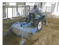
試験の様子(攪拌作業)

この技術による臭気発生低減効果を明らかにするとともに牛の行動等に及ぼす影響を観察し、有効性を検証します。(畜産研究部)