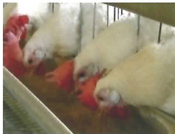
飽食しても休産している鶏

加齢により低下する産卵量と卵の品質を回復するため、これまで、低エネルギーの餌(ふすま)を与えて休産させる方法が用いられてきました。しかし、この方法では給餌量を制限する必要があるため、鶏に満腹感を与えることができずストレスとなっていました。そこで、ふすまにあわ殻を混ぜ、餌をさらに低エネルギーに改良することにより、鶏に飽食させ満腹感を与えながら休産させることが可能となりました。(畜産研究部)