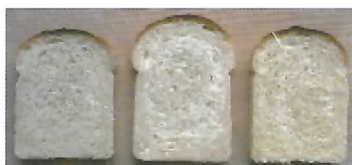
「春よ恋」北海道産 「1CW」カナダ産 「東海104号」