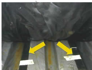
栽培槽に設置した培地加温用発熱体

バラは冬季18℃程度の高温で栽培するため、原油価格高騰の影響を強く受けています。そこで、後夜半の暖房温度を下げ(12℃)、培地加温(21℃)を行う方法で、収量品質を落とさず節油が可能になることを明らかにしました。今後、ヒートポンプも併せ一層の燃油削減を検討します。(園芸研究部)