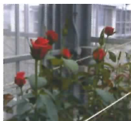
省エネ加温栽培での開花状況品種「ローランド」