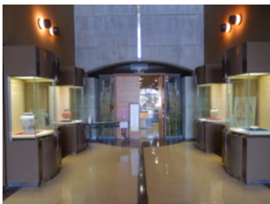
収蔵庫C前 展示ケース