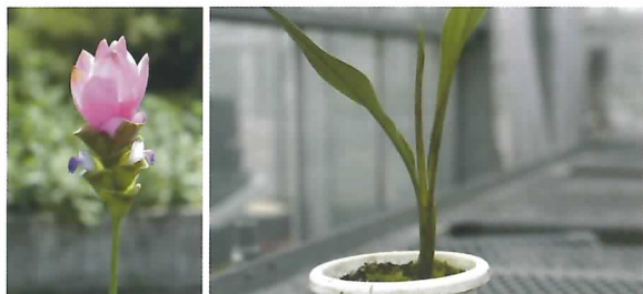
左：クルクマ「シャローム」の花