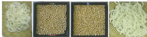
豪州産ASW きぬの波 × 西海184号 = 東海103号

国産小麦は、めん色の「くすみ」が商品性を大きく落とす原因の一つになっています。そこで、めん原料となる粉色が良い品種を効率的に開発するために、育種の素材となる品種系統の持つ粉色の良否を極少量の粉(0.5g)を基準品種と比較することにより簡易に判定する方法を開発しました。（作物研究部）