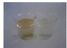
右：処理前(左) と処理後(右) の排水の様子