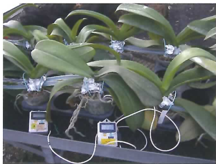
コチョウラン 株基部の冷却 試験の様子

コチョウランは開花のために、夏でも20～25℃の「低温」が必要です。そのため本県では、夏は昼夜ともクーラーを用いて、温室全体を冷房しており、多大な冷房費が問題となっています。今回、葉の付け根（株の基部）のみを冷やすことで、正常に開花する性質を見いだしました。現在、株の基部を局所的に冷房する装置を開発中です。（園芸研究部）